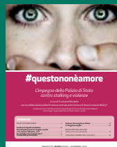
#QUESTONONÈAMORE Dicembre 2016