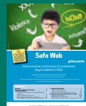
SAFE WEB PRIMA PARTE Agosto/settembre 2017