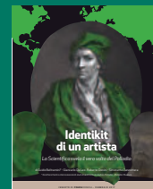
IDENTIKIT DI UN ARTISTA Febbraio 2017