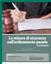
LE MISURE DI SICUREZZA NELL'ORDINAMENTO PENALE SECONDA PARTE Giugno 2017