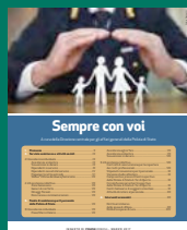
SEMPRE CON VOI Marzo 2017