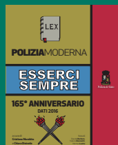
COMPENDIO DATI Aprile 2017