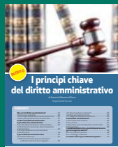
I PRINCIPI CHIAVE DEL DIRITTO AMMINISTRATIVO Gennaio 2017