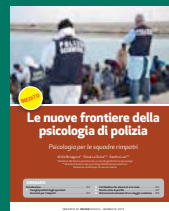
LE NUOVE FRONTIERE DELLA PSICOLOGIA DI POLIZIA Gennaio 2017