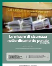
LE MISURE DI SICUREZZA NELL'ORDINAMENTO PENALE PRIMA PARTE Maggio 2017