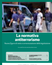
LA NORMATIVA ANTITERRORISMO Ottobre 2016