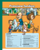
PROTEZIONE FAMILIARE Luglio 2017