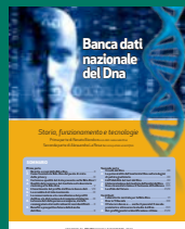
BANCA DATI NAZIONALE DEL DNA Novembre 2016